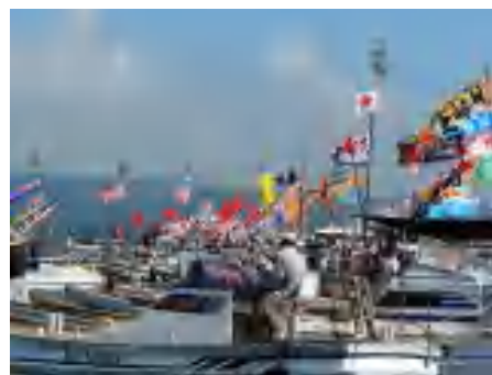
海上に集結した漁民1300人 9月10日

諫早干拓水門の開放、有明の地域の再生のため先生方の御力を賜りたく、院内集会を開催いたします。この院内集会では、長崎県の漁業者らが上京し、漁民が置かれた状況、そして長崎県民が即時開門を望んでいる実情を訴えます。先生方のご参加を心よりお待ちしております。